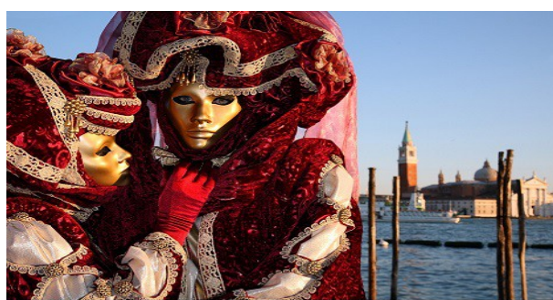
Image No.: 05338799 Italy, Venice carnival, masks in front of the lagoon and San Giorgio church

Faschingsdienstag, 5. März Samstag, 6. April Sonntag, 5. Mai Donnerstag, 9. Mai Mittwoch, 23. Mai Sonntag, 5. Mai