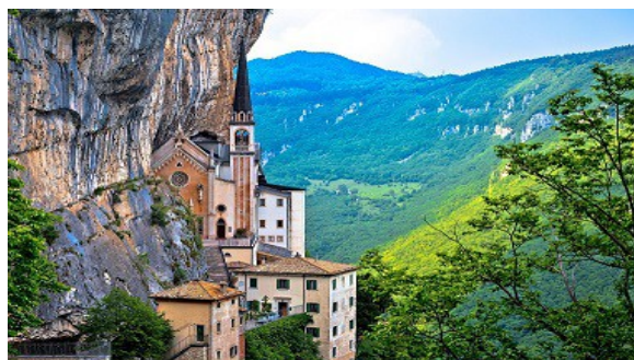
Madonna della Corona church on the rock, sanctuary in Trentino-Alto Adige region of Italy